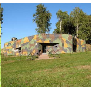
pěchotní srub Březinka