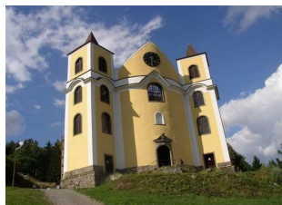
Kostel v Neratově se skleněnou střechou

Z Neratova pojedeme po prohlídce kostela Orlickýma horama – zapomenutou stranou hor odvrácenou k Polsku. Z Neratova stále do kopce až na Masarykovu chatu (25km) kde bude oběd. Pak bude cca 20 km sjezd do údolí řeky Metuje. V Pekle bude svačinka a pak alou proti proudu do campu (10 km)