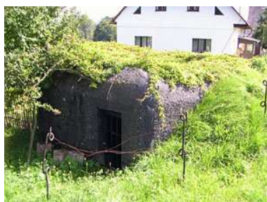
Lehký oběkt na Babí

9.00 – odjezd do po cyklostezce do Hronova na svačinu a pak směr Pavlišov po linii bunkrů (volně přístupných), na Pavlišově oběd u Vlasty. Pokračování po linii bunkrů přes Náchod na Březinku (exkluzivně dobově vybaný srub vč. původních originálních zbraní), pak dál do kopce na Dobrošovskou pevnost. V jejím podzemí je teplota okolo 10 stupňů. Pak přesun do Jiráskovi chaty na večeři a prohlídku Náchoda z její rozhledny. (cca 30 km)